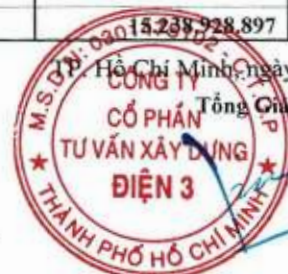
Lạc Thái Phước