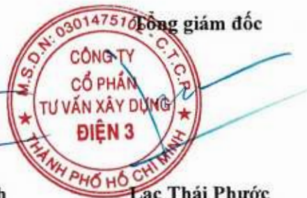
Lạc Thái Phước