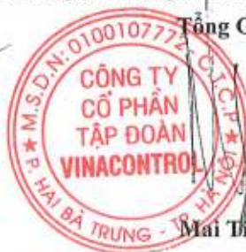
Mai Tiến Dũng