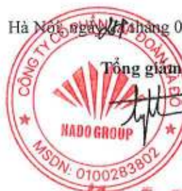
Đào Hữu Tùng