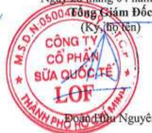
Đoàn Hữu Nguyên