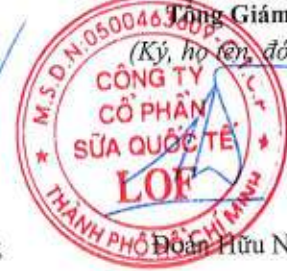
Đoàn Hữu Nguyên