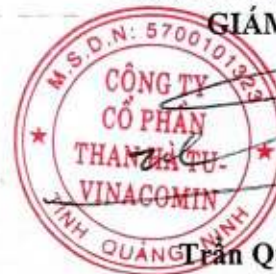
Trần Quốc Tuấn