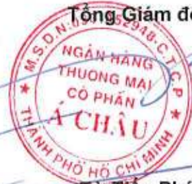
Từ Tiên Phát