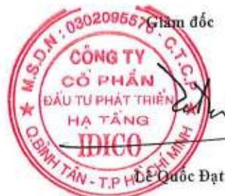
Đã Quốc Đạt