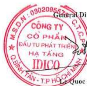
Le Quoc Dat