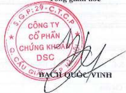
BẠCH QUỐC VINH