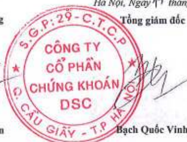
Bạch Quốc Vinh