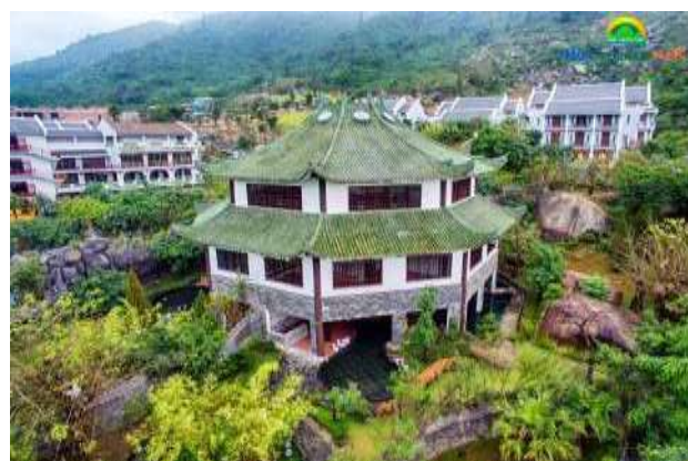
Khu khách sạn