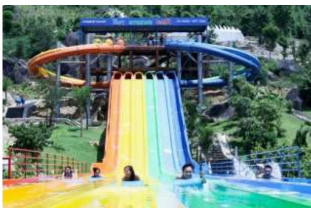
Công viên nước