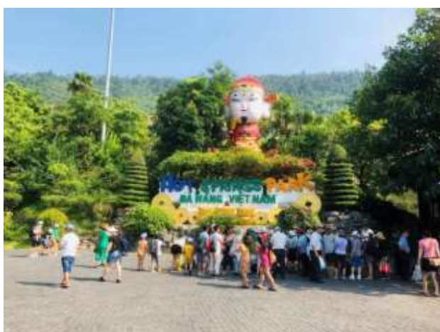
Công viên suối khoáng nóng Núi Thần Tài

Một số hình ảnh Công viên suối khoáng nóng Núi Thần Tài