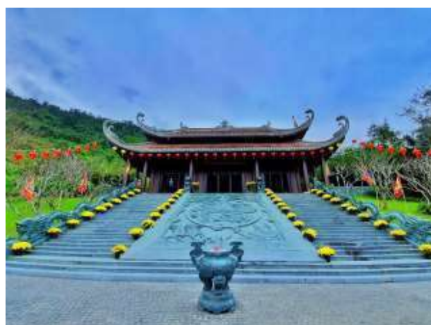
Đền thần tài