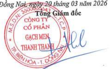
Trần Hưng Lương