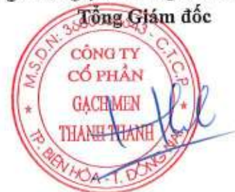
Trần Hưng Lương