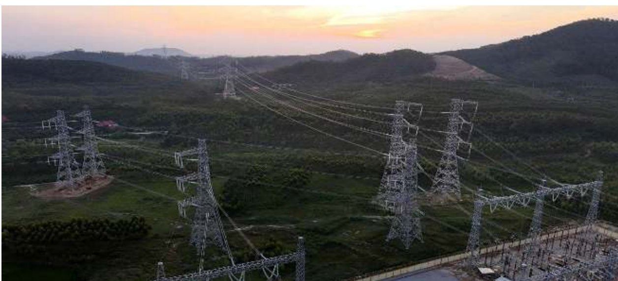
Đường dây 500kV Lào Cai - Vĩnh Yên khánh thành ngày 17-10-2025