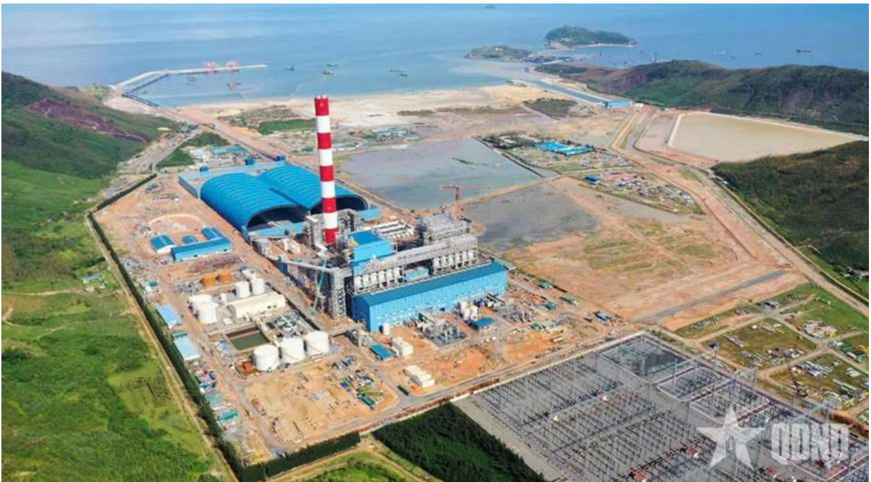
Nhà máy Nhiệt điện Quảng Trạch 1