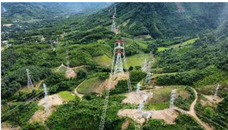
Đường dây 500kV Monsoon – Thanh Mỹ phục vụ nhập khẩu điện từ Lào về Việt Nam