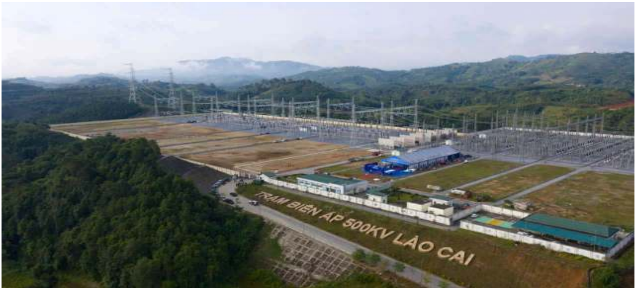
Trạm biến áp 500kV Lào Cai tại xã Xuân Quang, tỉnh Lào Cai