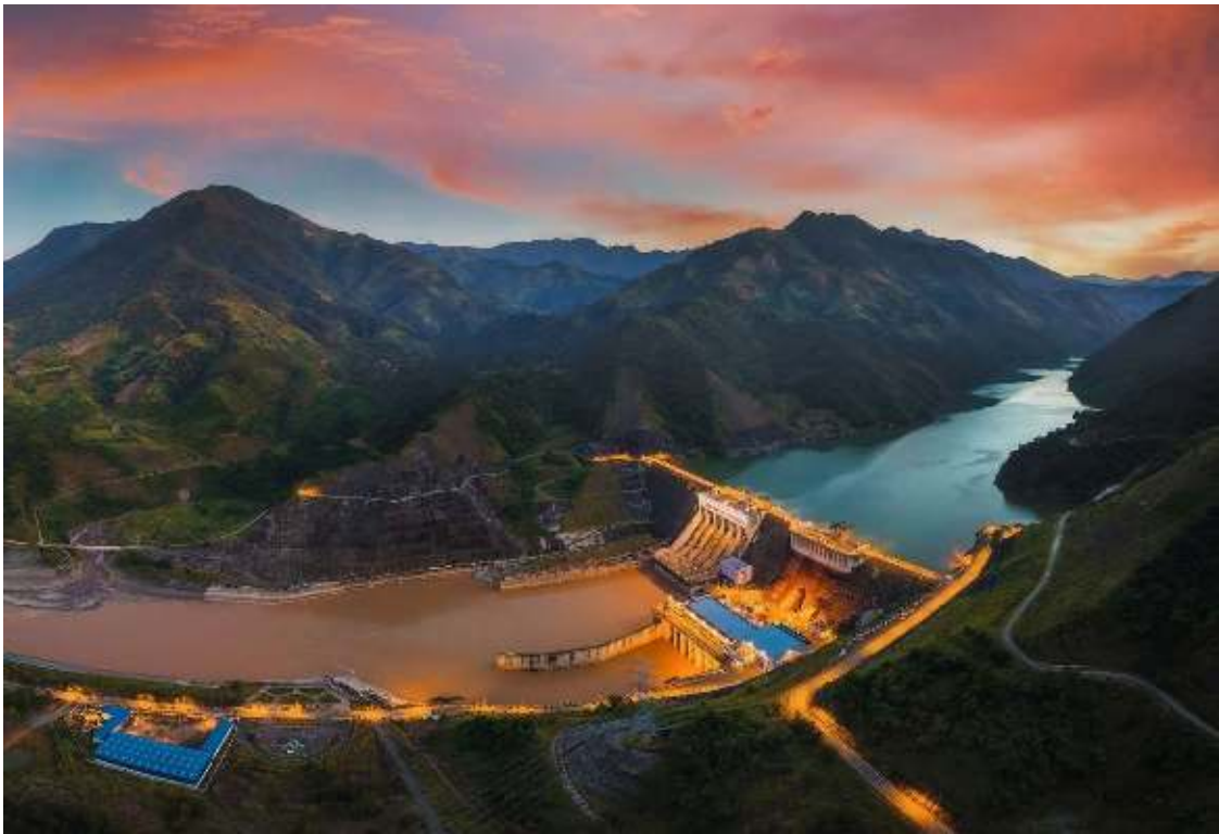
Thủy điện Lai Châu