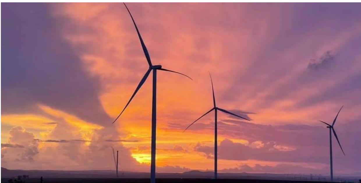
Nhà máy Điện gió Ia Pết Đăk Đoa 1, 2