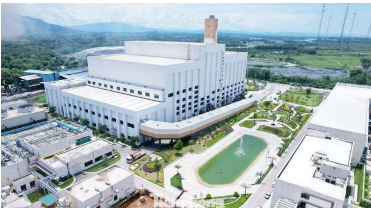
Nhà máy nhiệt điện rác Seraphin khánh thành ngày 18-9-2025