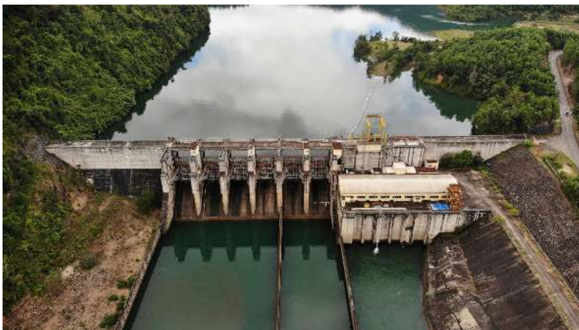
Thủy điện Sông Bung 5 về đích sớm 28 ngày, hoàn thành 236,6 triệu kWh