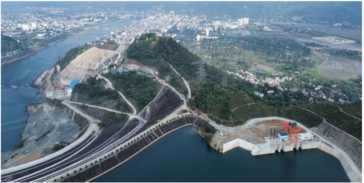
Một góc Nhà máy Thủy điện Hòa Bình mở rộng