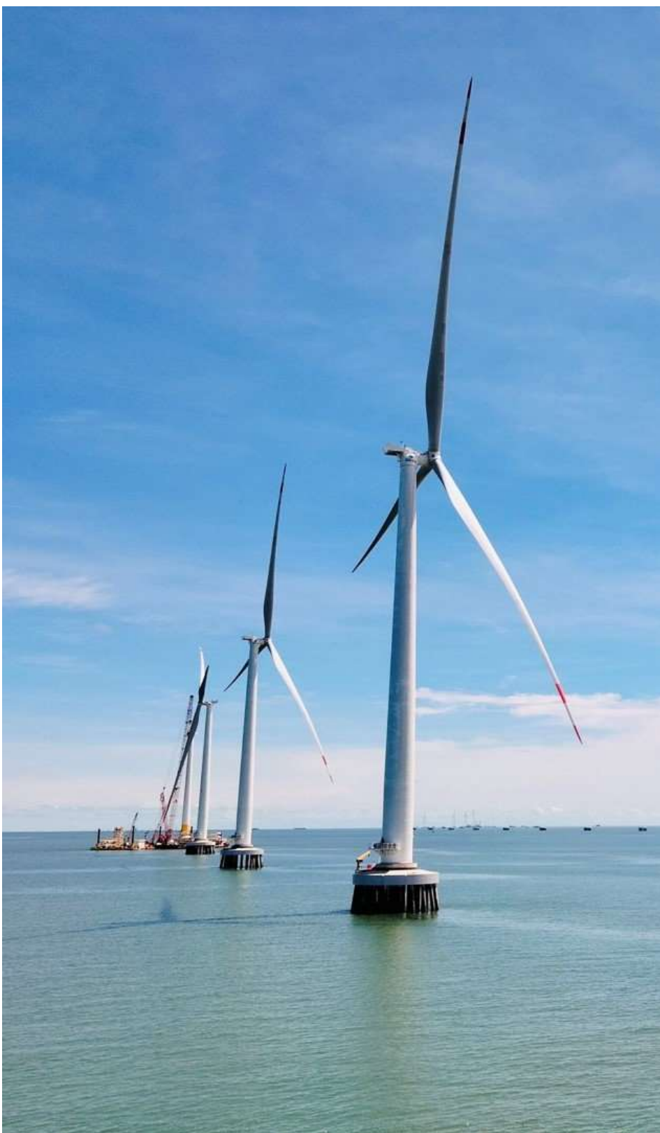
Nhà máy Điện gió Cà Mau 1A