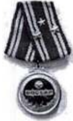
Huân chương Độc lập Hàng Nhất