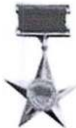
Anh hùng LLVT Nhân dân