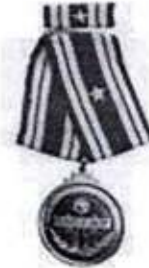
Huân chương Độc lập Hàng Ba