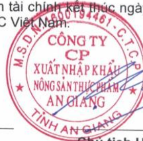
Chủ tịch HĐQT