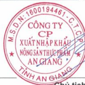
Chủ tịch HĐQT