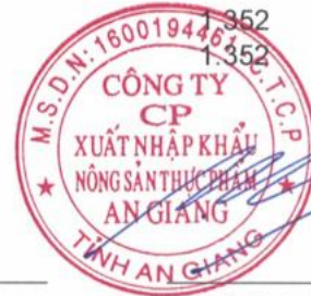
Chủ tịch HĐQT