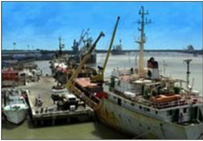
Dịch vụ cầu cảng