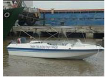
Cano Composite cao tốc