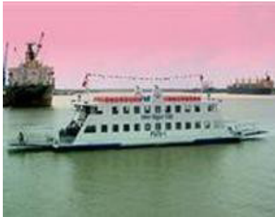
Tàu du lịch, tàu khách