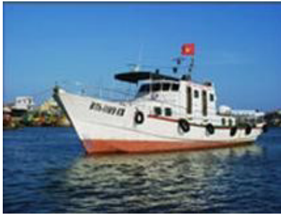
Tàu tuần tra, kiểm ngư