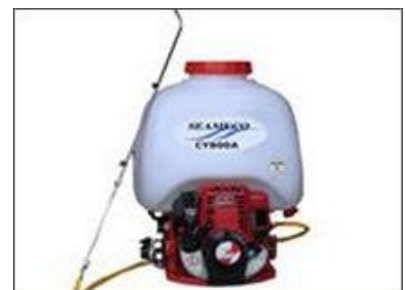
Máy phun thuốc