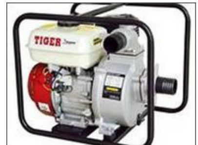
Máy xăng Máy cắt cỏ Máy bơm nước