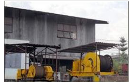
Dịch vụ lên xuống xà lan