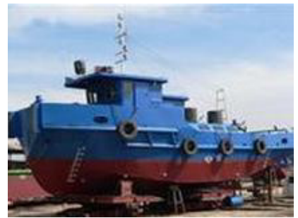
Tàu vỏ thép