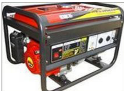
Máy phát điện