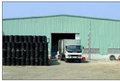
Dịch vụ kho bãi