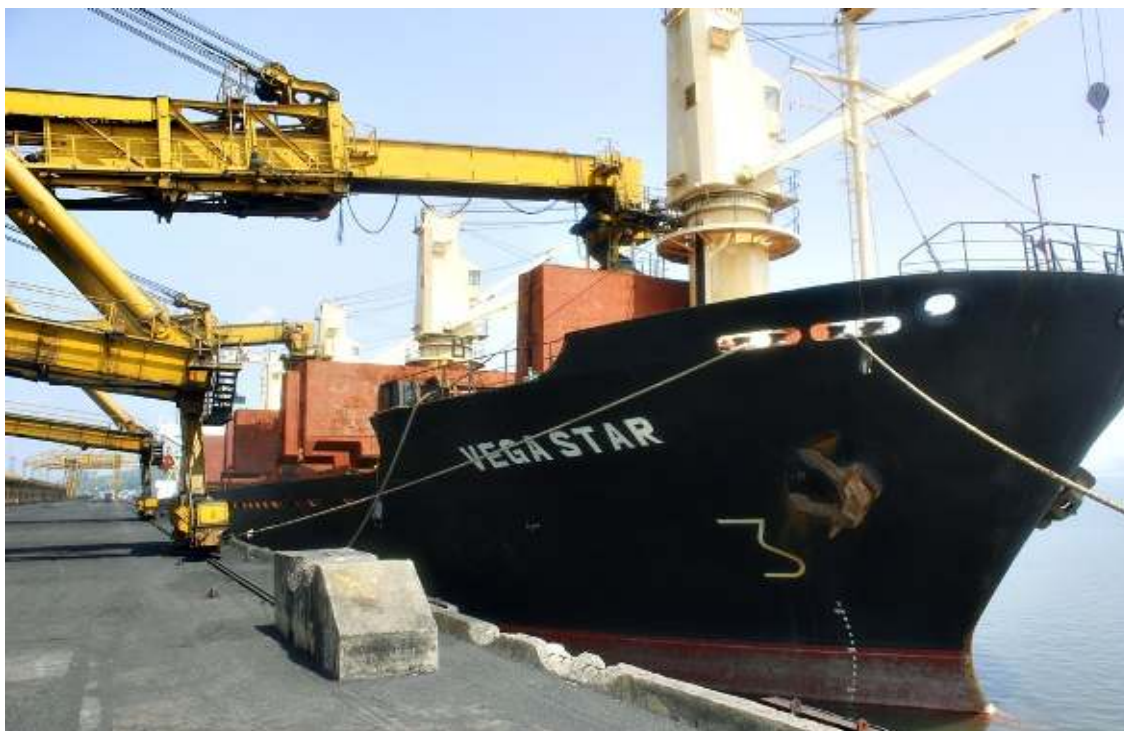
Giám định hàng hóa bằng mẫu nước tàu biển tại cảng Cửa Ông