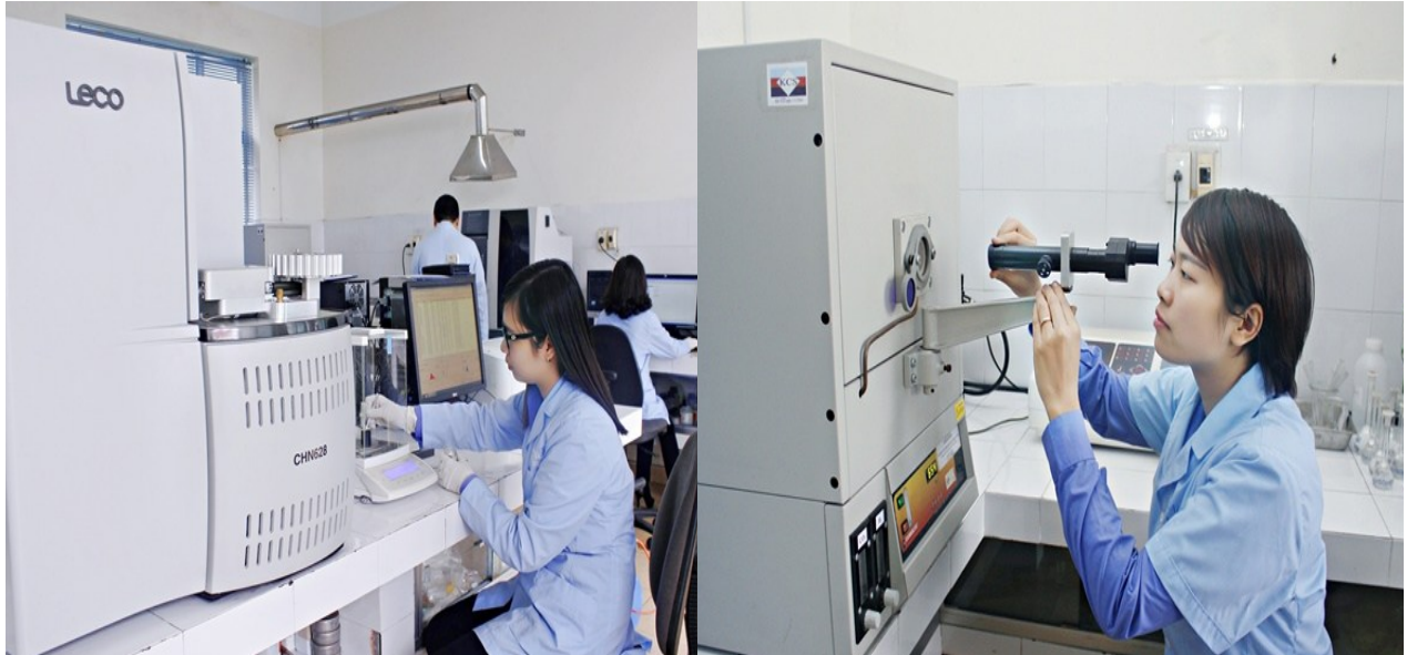
Một số thiết bị phân tích tại phòng Hóa nghiệm công ty

- Trang bị các thiết bị phân tích nhiệt năng, lưu huỳnh đến các Trung tâm, Trạm giám định nhằm đáp ứng kịp thời cho sản xuất. Quản lý hệ thống thiết bị trong toàn công ty, hướng dẫn, chuyển giao công nghệ vận hành thiết bị cho các đơn vị sản xuất nhằm quản lý và phát huy thiết bị hiệu quả nhất.