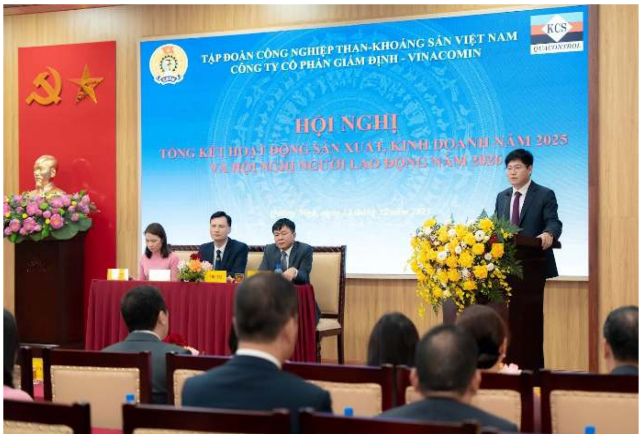
Hội nghị tổng kết hoạt động SXKD năm 2025 và Hội nghị đại biểu người lao động năm 2026