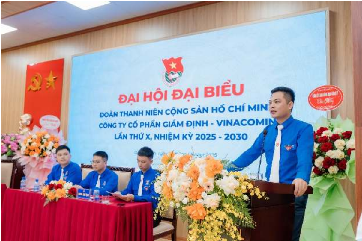
Đại hội Đoàn thanh niên công ty lần thứ X, nhiệm kỳ 2025-2030