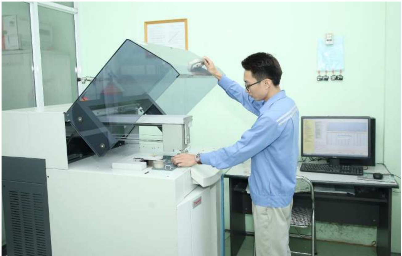
Phân tích Các thành phần oxit trên máy Quang phổ Huỳnh Quang tia X (XRF)