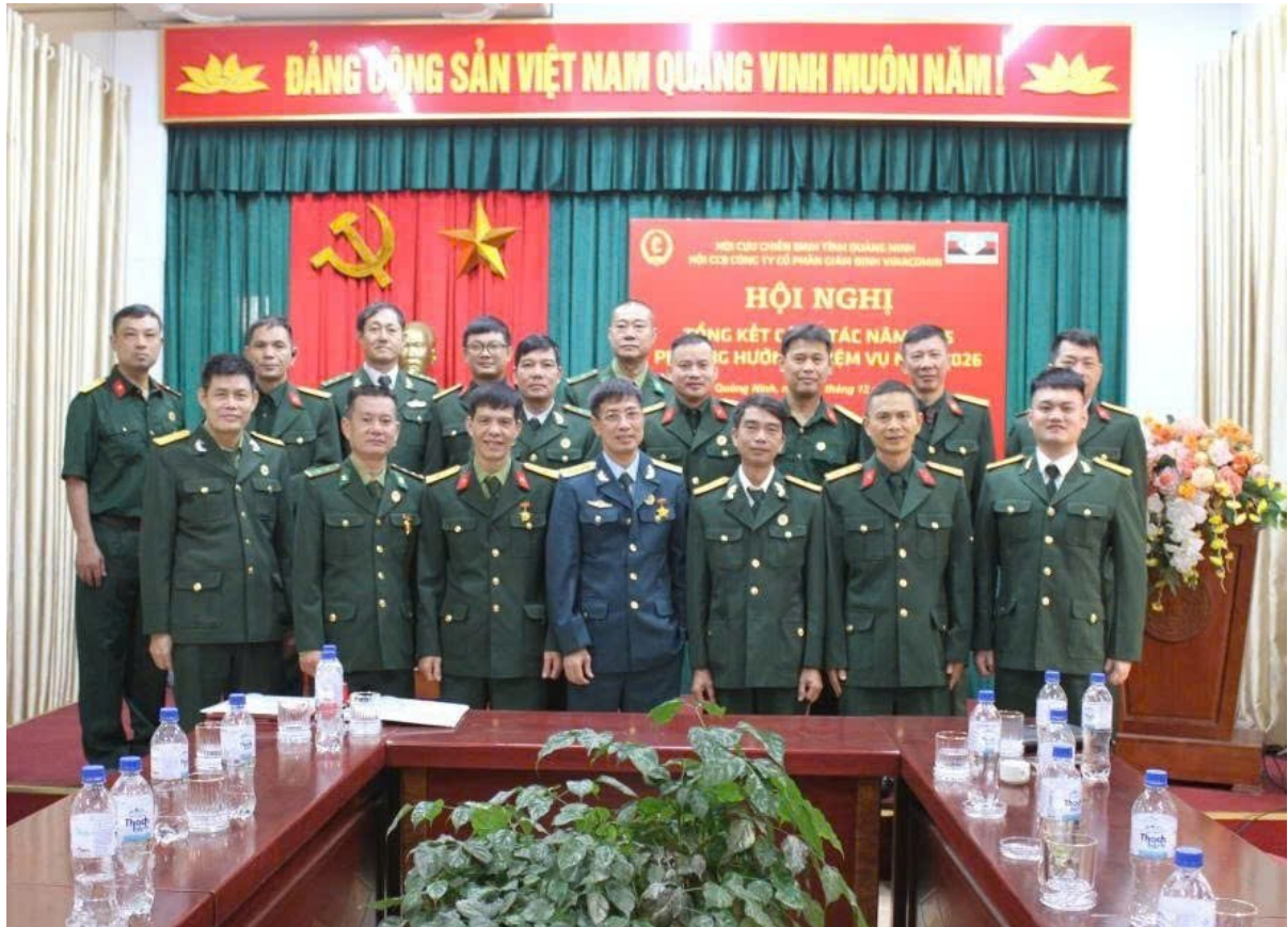
Hội Cựu chiến binh công ty tổng kết công tác 2025, triển khai nhiệm vụ 2026