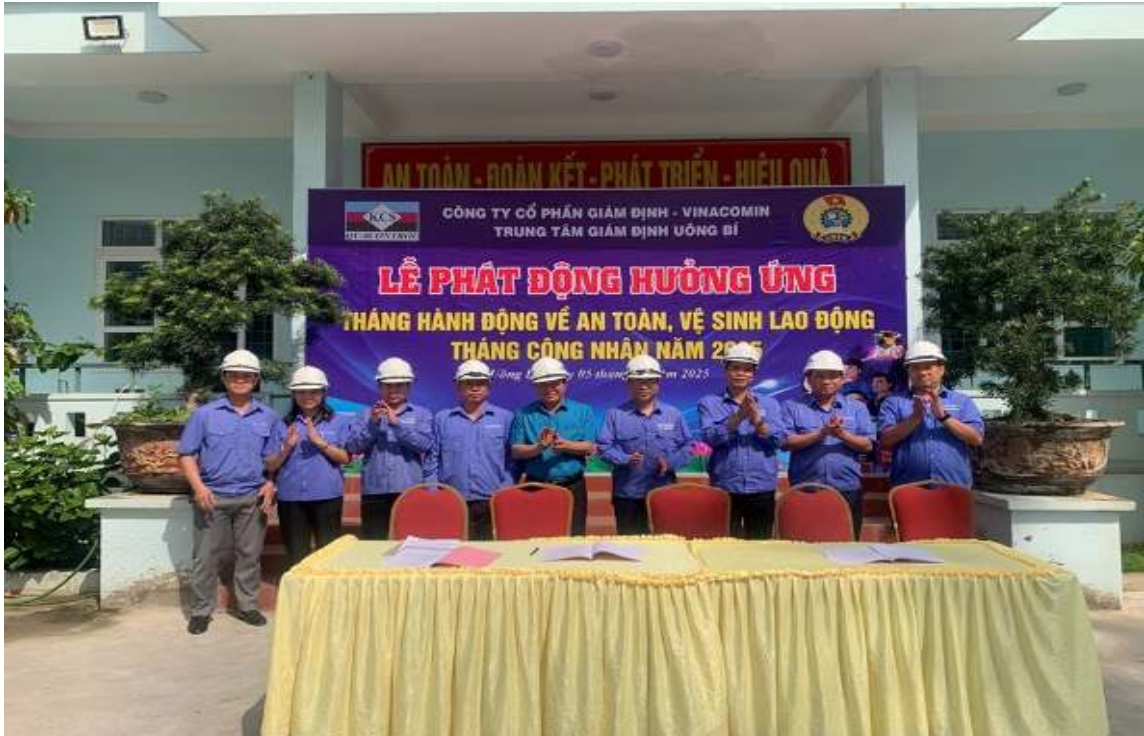
Phát động hưởng ứng tháng hành động về AT-VSLĐ đồng loạt tại các đơn vị trực thuộc công ty