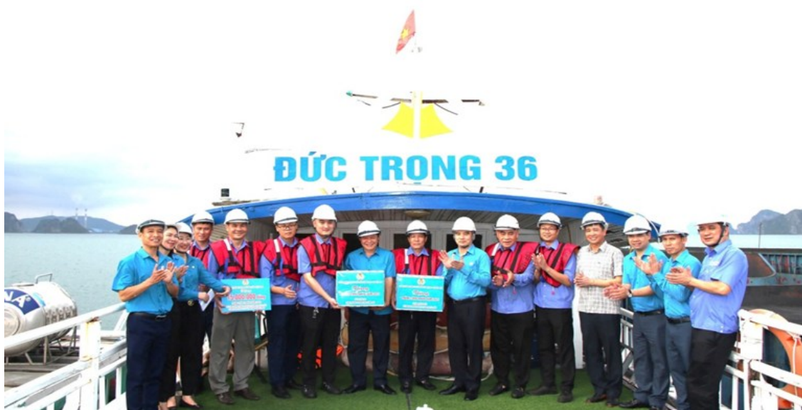
Thăm hỏi, tặng quà tập thể lao động xuất sắc tiêu biểu nhân tháng công nhân, tháng hành động về AT-VSLĐ