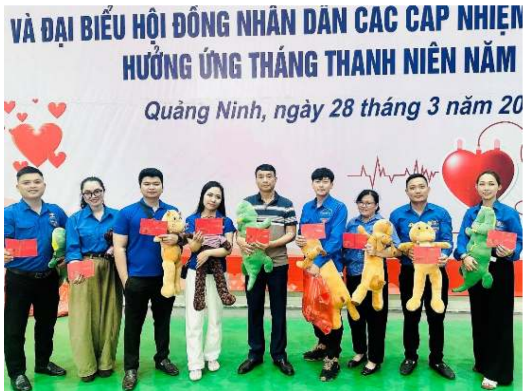
Tham gia chương trình hiến máu tình nguyện