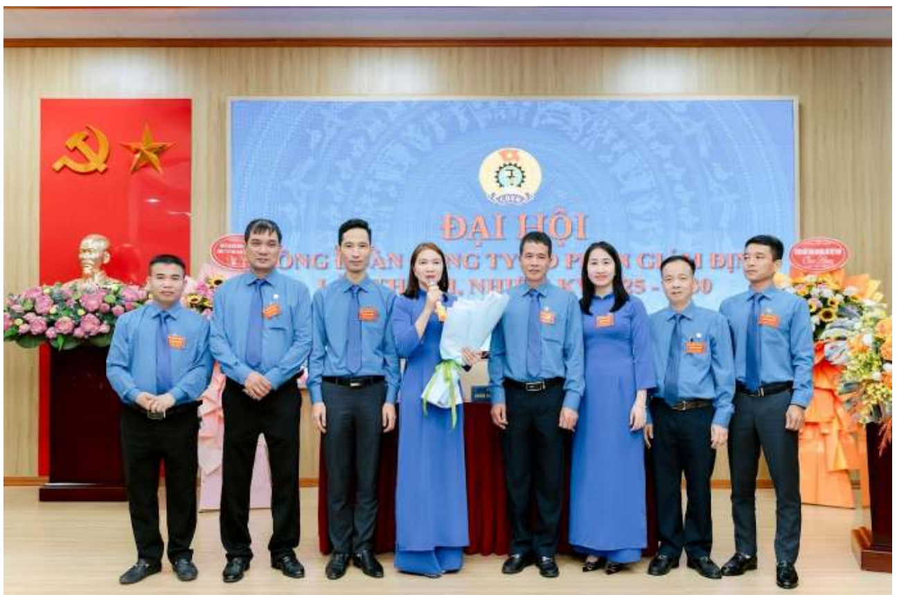
Ban chấp hành Công đoàn Công ty khóa XI, nhiệm kỳ 2025-2030 ra mắt Đại hội

- Hội CCB công ty triển khai thực hiện tốt Nghị quyết Đại hội Hội Cựu chiến binh công ty lần thứ III, nhiệm kỳ 2022-2027.