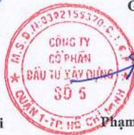
Phạm Danh Tuyên