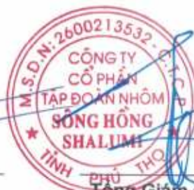
Tổng Giám đốc