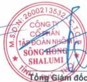
Tổng Giám đốc