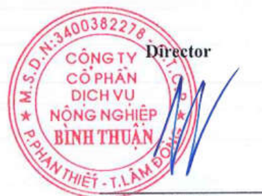
Do Viet Ha