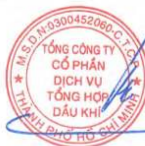
Phùng Tuấn Hà Chủ tịch Hội đồng Quản trị Ngày 27 tháng 3 năm 2026

Các thuyết minh từ trang 10 đến trang 56 là một phần cấu thành báo cáo tài chính riêng này.