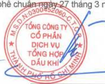
Phùng Tuấn Hà Chủ tịch Hội đồng Quản trị