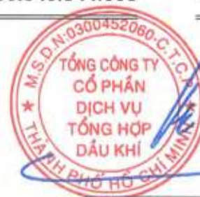
Phùng Tuấn Hà Chủ tịch Hội đồng Quản trị Ngày 27 tháng 3 năm 2026

Các thuyết minh từ trang 10 đến trang 56 là một phần cấu thành báo cáo tài chính riêng này.