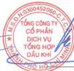
Phùng Tuấn Hà Chủ tịch Hội đồng Quản trị Ngày 27 tháng 3 năm 2026

Các thuyết minh từ trang 10 đến trang 56 là một phần cấu thành báo cáo tài chính riêng này.