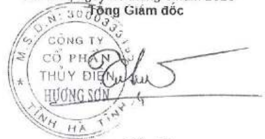
Phạm Tiến Dũng

Các thuyết minh từ trang 10 đến trang 30 là bộ phận hợp thành của báo cáo tài chính