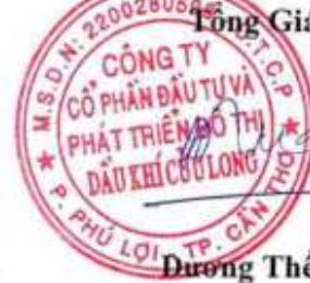
Dương Thế Nghiêm