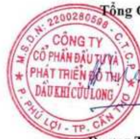
Dương Thế Nghiêm