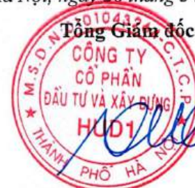
Lê Thanh Hải