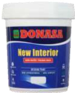
Sơn New Interior - Sơn Nội thất