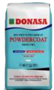
Bột trét Powdercoat