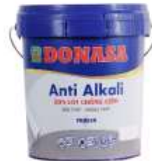
Sơn lót Anti - Sơn lót chống kiềm