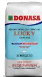
Bột trét Lucky