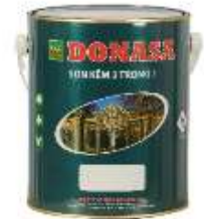
Sơn kềm 2 trong 1