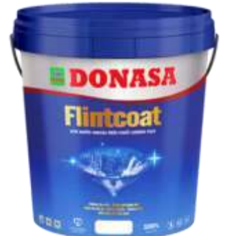
Sơn Flintcoat - Sơn ngoại thất Cao cấp