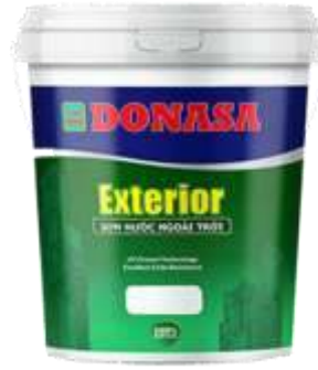
Sơn Exterior - Sơn Ngoại thất