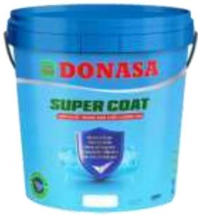
Sơn Super Coat - Sơn Nội thất Cao cấp