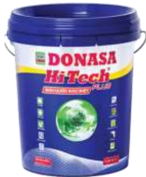
Sơn Hitech Plus - Sơn Ngoại thất Cao cấp