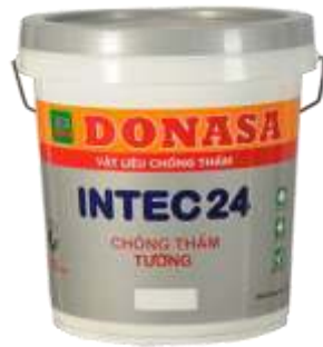
Chống Thấm INTEC 24_Tường/Sàn