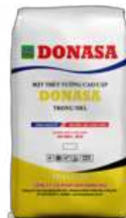
Bột trét Donasa