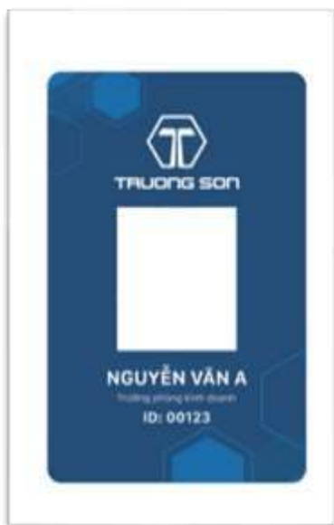
Thẻ nhân viên sử dụng trong nội bộ công ty