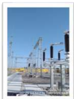
Trạm biến áp 110kV Bình Lục