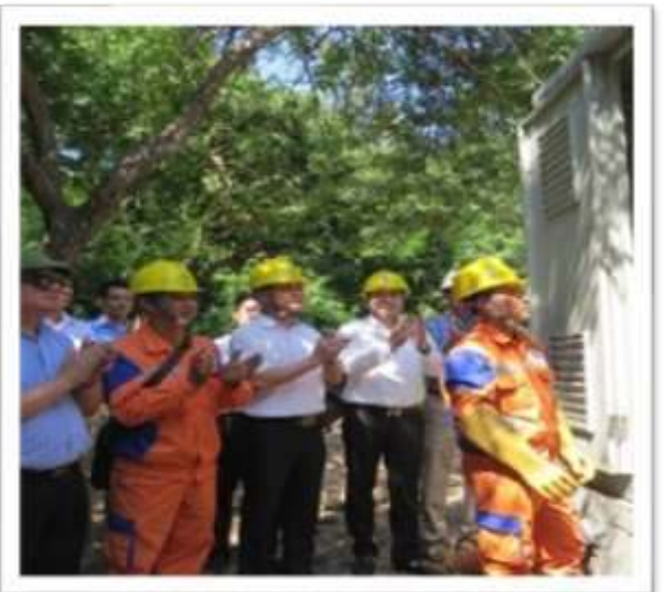
Dự án cấp điện lưới Quốc gia cho Đảo Rều, thành phố Cẩm Phả, tỉnh Quảng Ninh