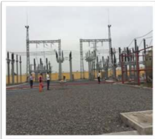
Trạm biến áp 110kV Kim Bảng