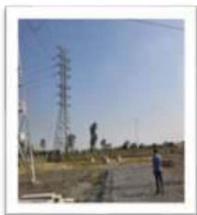
Dự án Đường dây 110kV Bá Thiện – Khai Quang