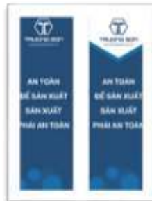
Banner phục vụ các chiến dịch quảng cáo