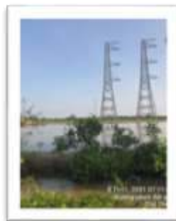
Dự án Đường dây 500kV Sông Hậu – Đức Hòa