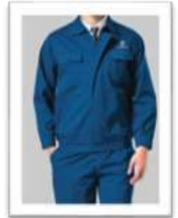
Đồng phục kỹ sư, KTV