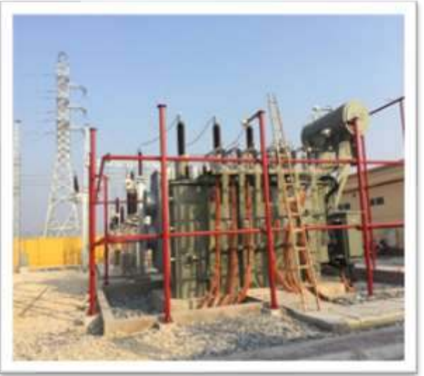
Trạm biến áp 110kV Đồng Văn 3