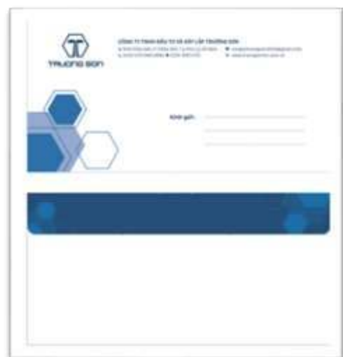
Phong bì thư sử dụng để gửi văn bản, tài liệu