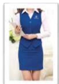
Đồng phục lễ tân