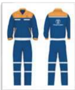
Trang phục bảo hộ