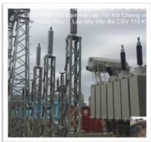
Trạm biến áp 110kV Chương Mỹ