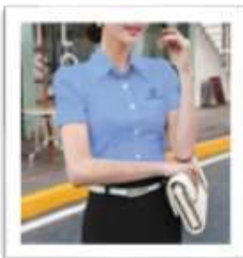
Đồng phục văn phòng