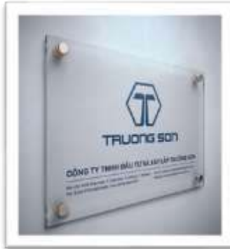
Bảng tên Công ty sử dụng ở cửa văn phòng