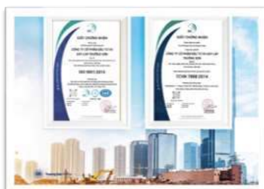
Chứng nhận quy chuẩn IQC