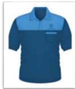
Áo phông sử dụng trong các hoạt động nội bộ của Công ty