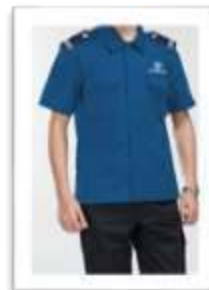
Đồng phục bảo vệ