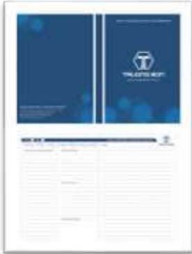
Bìa và mặt trong của sổ tay sử dụng nội bộ và làm quà tặng cho khách hàng