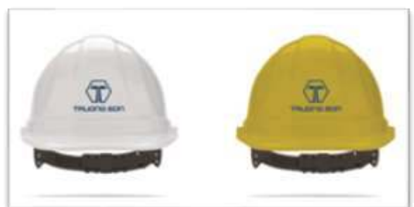
Mũ bảo hộ