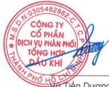
Vũ Tiến Dương Chủ tịch HĐQT Ngày 24 tháng 3 năm 2026

Các thuyết minh từ trang 9 đến trang 42 là một phần cấu thành báo cáo tài chính riêng này.