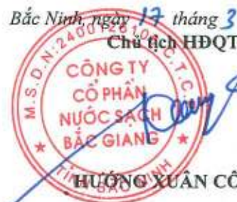
HOÀNG XUÂN CÔNG