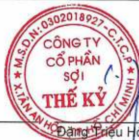
Đặng Triệu Hòa Chủ tịch Hội đồng Quản trị