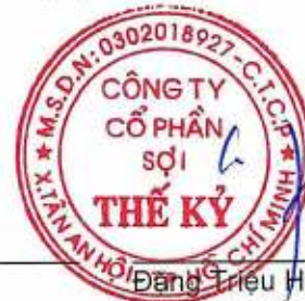
Đặng Triệu Hòa Chủ tịch Hội đồng Quản trị