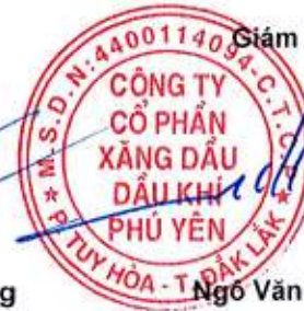
Ngô Văn Nhiệm

Các thuyết minh từ trang 9 đến trang 39 là bộ phận hợp thành của Báo cáo tài chính