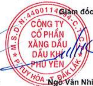
Ngô Văn Nhiệm

Các thuyết minh từ trang 9 đến trang 39 là bộ phận hợp thành của Báo cáo tài chính