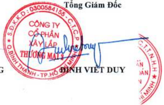
ĐINH VIỆT DUY