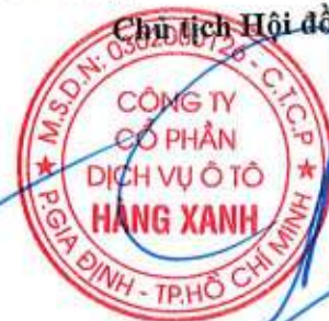
ĐỖ TIỀN DŨNG