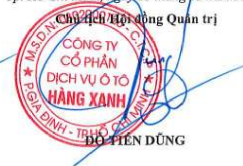
ĐỖ TIÊN DŨNG