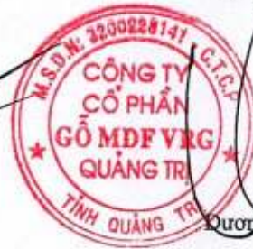
Đương Tấn Thành