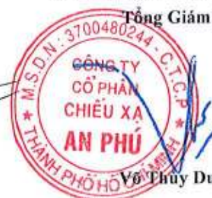
Võ Thủy Dương