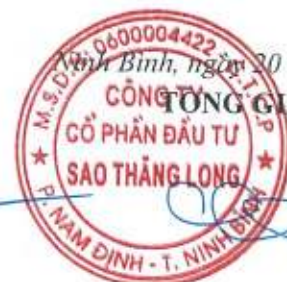
Trần Quốc Thuận