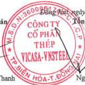
Ngô Tiến Thọ