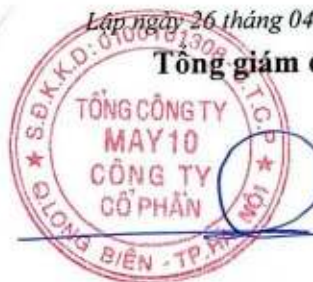
Thân Đức Việt