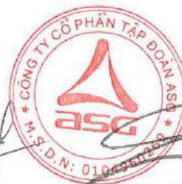
Dương Đức Tính Chủ tịch Hội đồng quản trị