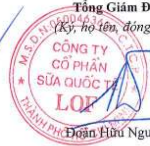
Đoàn Hữu Nguyên