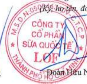
Đoàn Hữu Nguyên