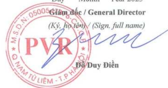
Đỗ Duy Điền