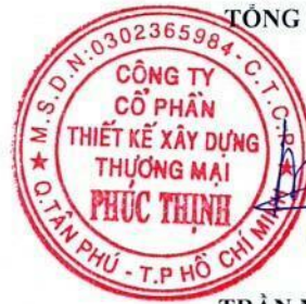
TRẦN MINH TRÚC