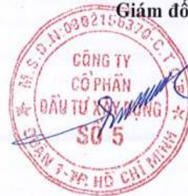
Phạm Danh Tuyên