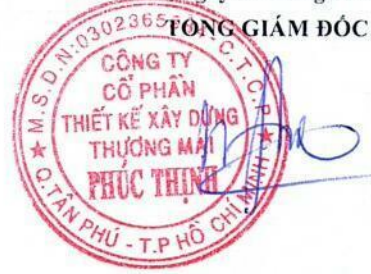
TRẦN MINH TRÚC