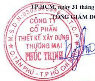
TRẦN MINH TRÚC