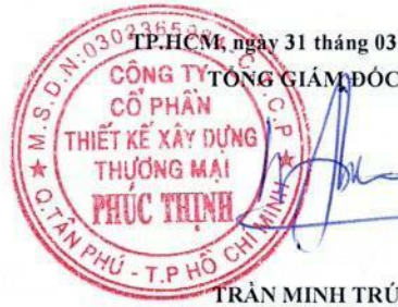
TRẦN MINH TRÚC