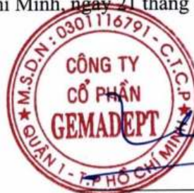
Khoa Năng Lưu Kế toán trưởng