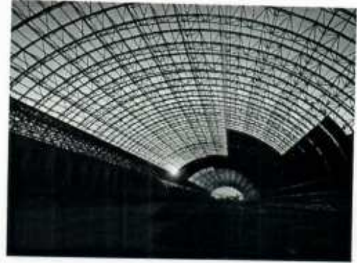
Hình ảnh 8: Giàn không gian Dung Quất-Hòa Phát

- Nhóm sản phẩm nhôm hợp kim định hình chất lượng cao (từ 2005)