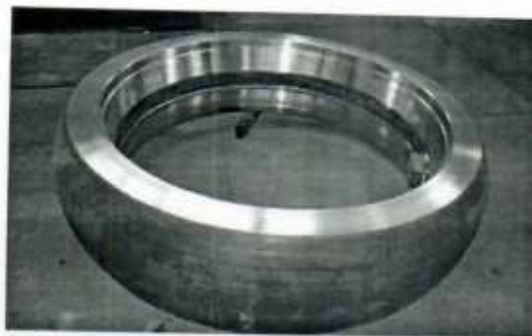
Hình ảnh 2: Vỏ con lăn nghiền xi măng