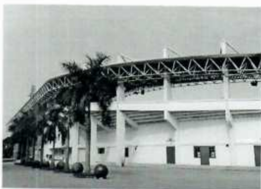
Hình ảnh 5: Sân vận động TP. Việt Trì

Công ty đã xuất khẩu sản phẩm giàn không gian sang thị trường UAE và Namibia và đang trong quá trình thương thảo một số dự án khác tại thị trường Trung Đông và Châu Phi.