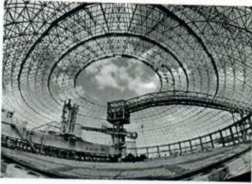
Hình ảnh 7: Giàn không gian CKDA xuất khẩu sang Namibia-Châu Phi