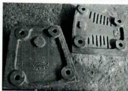
Hình ảnh 4: Phụ tùng máy nghiền

- Nhóm sản phẩm Giàn không gian và Kết cấu thép (từ 2001)