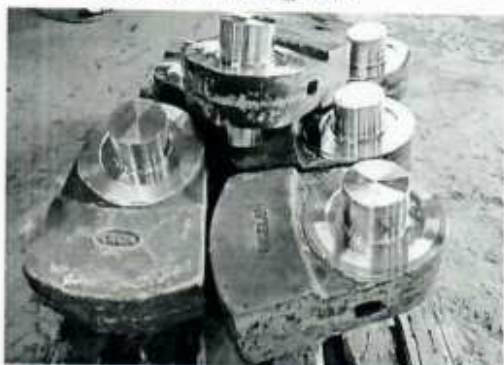
Hình ảnh 3: Sản phẩm Búa đập