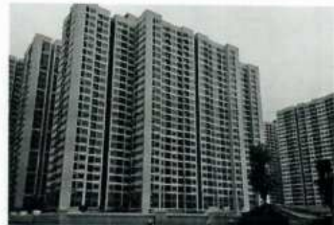
Hình ảnh 12: Sản phẩm DAA lắp đặt tại Vinhomes Ocean Park