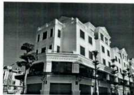
Hình ảnh 10: Sản phẩm DAA lắp đặt tại Vinhomes Cầu Rào 2 Hải Phòng