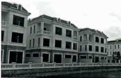
Hình ảnh 11: Sản phẩm DAA lắp đặt tại Vinhomes Imperia Hải Phòng