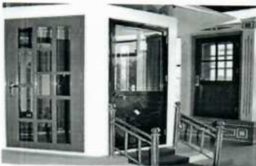
Hình ảnh 9: Cửa nhôm cao cấp do nhà máy nhôm Đông Anh sản xuất

Được sử dụng trong kiến trúc cho các toà nhà cao tầng hay hộ gia đình, làm đồ nội thất và phụ tùng, phụ kiện của các ngành công nghiệp đóng tàu, sản xuất ô tô và các ngành công nghiệp khác. Các sản phẩm này được chế tạo bằng dây chuyền công nghệ, thiết bị hiện đại như dây chuyền thiết bị đùn ép của hãng sản xuất máy ép hàng đầu trên thế giới UBE-Nhật Bản và hệ thống dây chuyền anốt hoá, mạ cầu, phủ bóng E.D, sơn tĩnh điện, phủ film... do tập đoàn Decoral System SRL Italia cung cấp. Sản phẩm có chất lượng cao và đạt tiêu chuẩn Châu Âu.