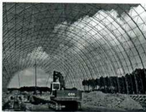
Hình ảnh 6: Kho Tổng hợp Nhà máy xi măng Đồng Lâm - tỉnh Thừa Thiên Huế