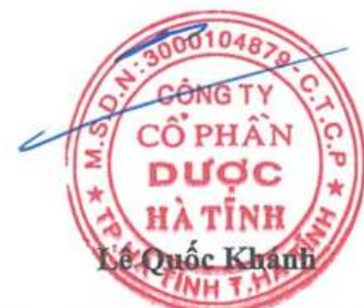
Lê Quốc Khánh

(Các thuyết minh từ trang 11 đến trang 39 là bộ phận hợp thành của Báo cáo tài chính này.)