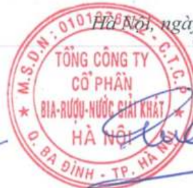
Ngô Quế Lâm