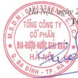
Ngô Quốc Lâm