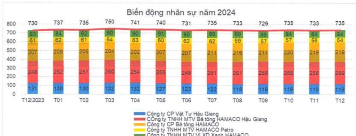
Bảng 3: Tình hình biến động Nhân sự năm 2024

(Nguồn: Phòng Hành chính nhân sự – Công ty Cổ phần Vật tư Hậu Giang)