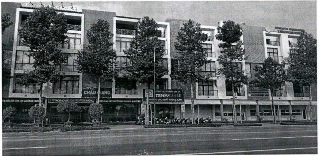
Hình ảnh nhà Dự án GREEN PEARL – TPM.BD (Giáp Đường Lê Lợi)