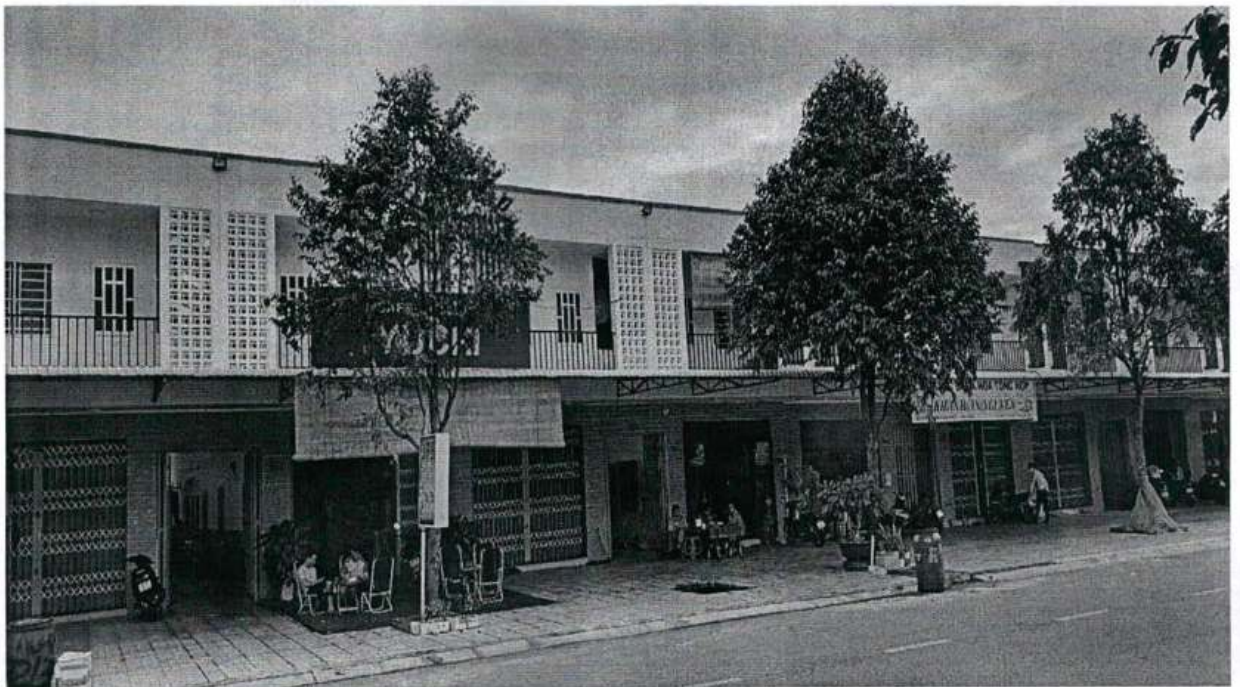
Hình ảnh nhà tại Lô A51/ Bàu Bàng (Bàn giao khách hàng)

- Chi phí SXKD.DD đến ngày 31/12/2024: 2,40 tỷ đồng.