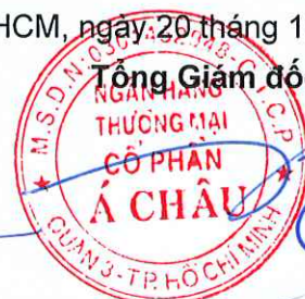
Từ Tiến Phát